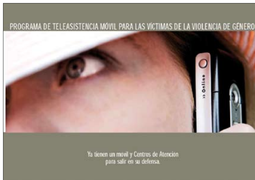
Figura 4. Tríptico informativo sobre la existencia de la teleasistencia para mujeres afectadas por la violencia de género, 2007 (Melilla)

En las reuniones que se celebran con los diferentes equipos de atención primaria por parte de la gerencia y de la dirección médica se incluye como un punto del orden del día el seguimiento de la observancia del protocolo, recordando su gran utilidad para los y las profesionales de la sanidad ya que en este ámbito se tiene el contacto más inmediato y directo con las víctimas y su fundamental aportación para erradicar esta lacra social.